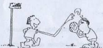
Proibido lançar !