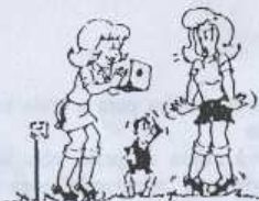
O Corfebol Joga-se com uma bola redonda