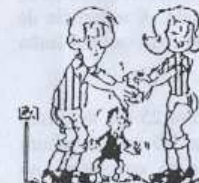
O Corfebol é uma actividade mista