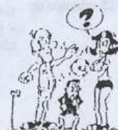
Defesa só aos jogadores do mesmo sexo !