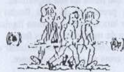
intervalo muda-se de campo