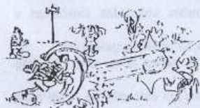
O Corfebol joga-se com as mãos