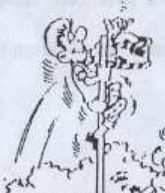
Não é permitido tocar no poste !